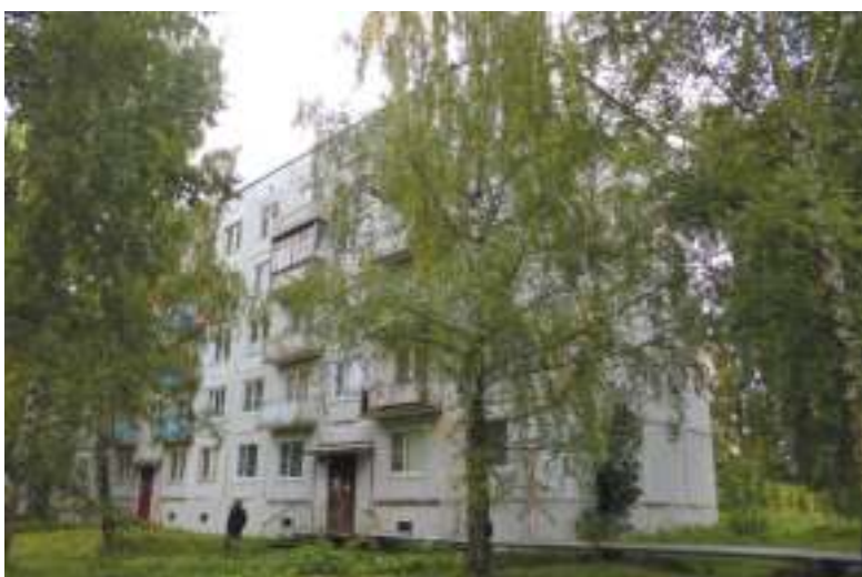
ПОСЕЛОК ДОРОХОВО, ДОМ №8