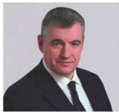
СЛУЦКИЙ ЛЕОНИД ЭДУАРДОВИЧ

1968 года рождения; место жительства – город Москва; Государственная Дума Федерального Собрания Российской Федерации, депутат, руководитель фракции Политической партии ЛДПР – Либерально-демократической партии России, председатель Комитета Государственной Думы по международным делам; выдвинут политической партией «Политическая партия ЛДПР – Либерально-демократическая партия России»; член политической партии «Политическая партия ЛДПР – Либерально-демократическая партия России»; Руководитель Высшего Совета партии, Председатель партии