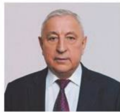
ХАРИТОНОВ НИКОЛАЙ МИХАЙЛОВИЧ

1948 года рождения; место жительства – город Москва; Государственная Дума Федерального Собрания Российской Федерации, депутат, председатель Комитета Государственной Думы по развитию Дальнего Востока и Арктики; выдвинут политической партией «Политическая партия «КОММУНИСТИЧЕСКАЯ ПАРТИЯ РОССИЙСКОЙ ФЕДЕРАЦИИ»; член политической партии «Политическая партия «КОММУНИСТИЧЕСКАЯ ПАРТИЯ РОССИЙСКОЙ ФЕДЕРАЦИИ»; член Центрального Комитета партии, член Президиума Центрального Комитета партии