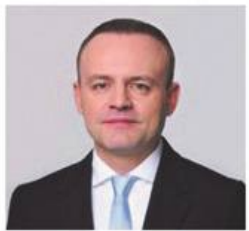
ДАВАНКОВ ВЛАДИСЛАВ АНДРЕЕВИЧ

- Считаю своей жизненной позицией - пойти на выборы Президента России. Мои родители, мои предки всегда выполняли свой гражданский долг. И я не исключение в моей семье. К этому приучаю и своих детей, ведь воспитание патриотизма одна из составляющих семейных ценностей. Более 25 лет являюсь секретарем участковой избирательной комиссии. Поэтому знаю, что должна, обязана, это мой долг перед Родиной!