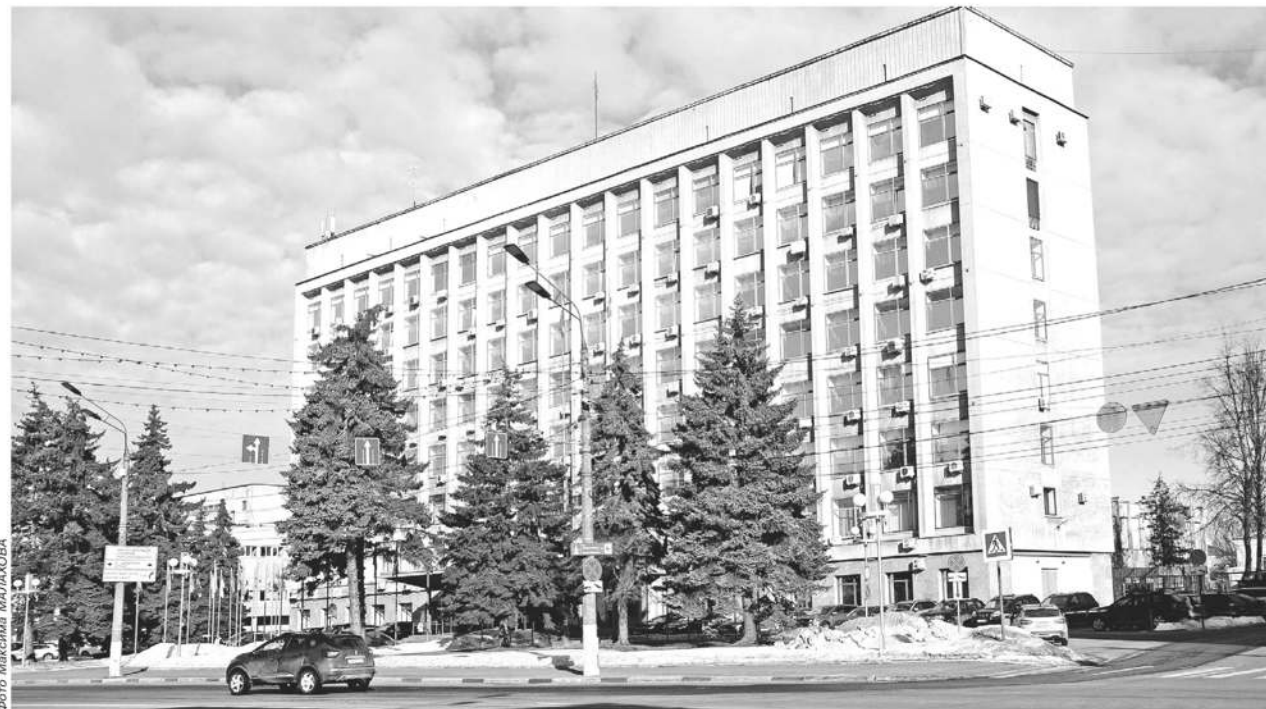
Здание Законодательного Собрания, расположенное на ул. Советской, 33 является архитектурной доминантой современной Твери

Среди традиций нашего областного парламента надо прежде всего выделить преемственность депутатского корпуса. 30-40% депутатов как правило переизбираются в новый состав, что позволяет сохранить опыт, понимание того как работают законотворческие механизмы, как на практике действуют законы.